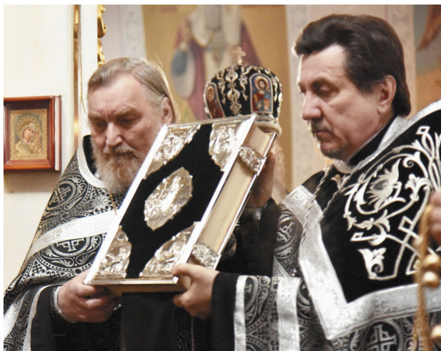
Фото на обложке:

1 стр. – Храм святого мученика Виктора села Ключевка Пономаревского района.